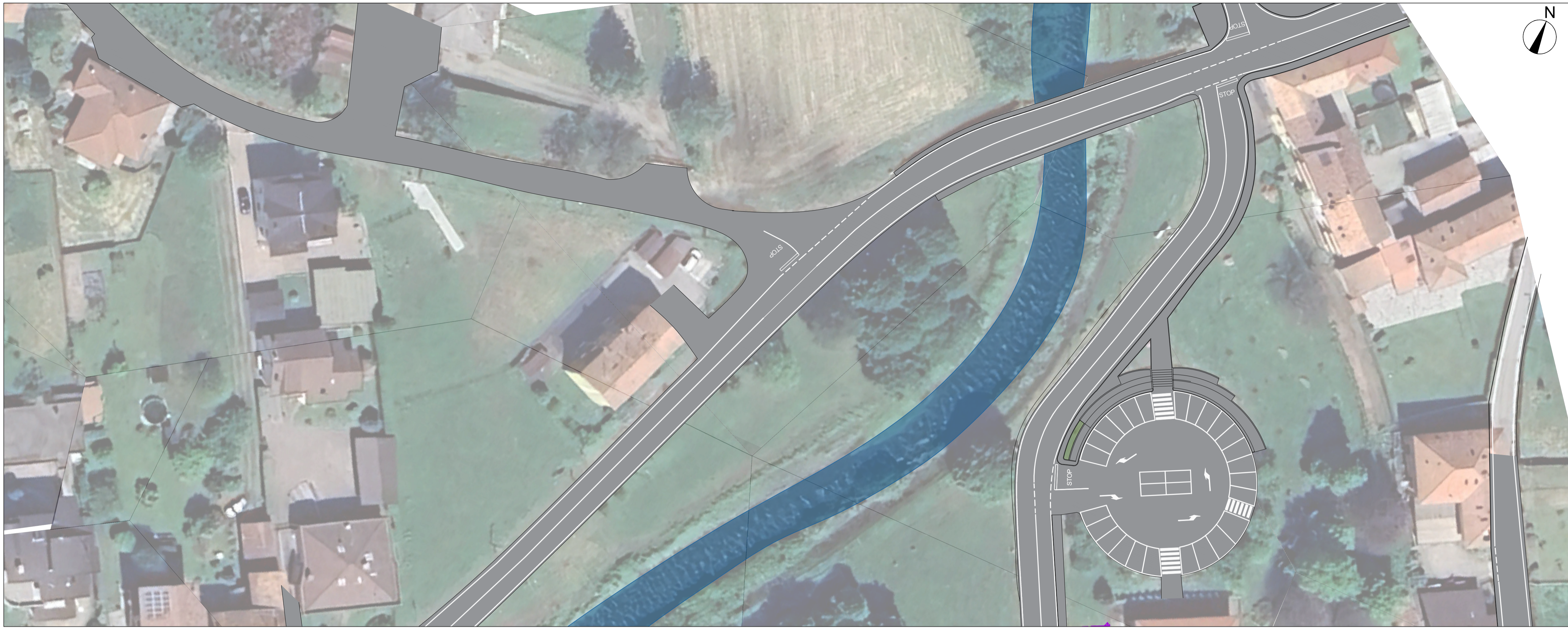
STATO DI FATTO Scala 1:500