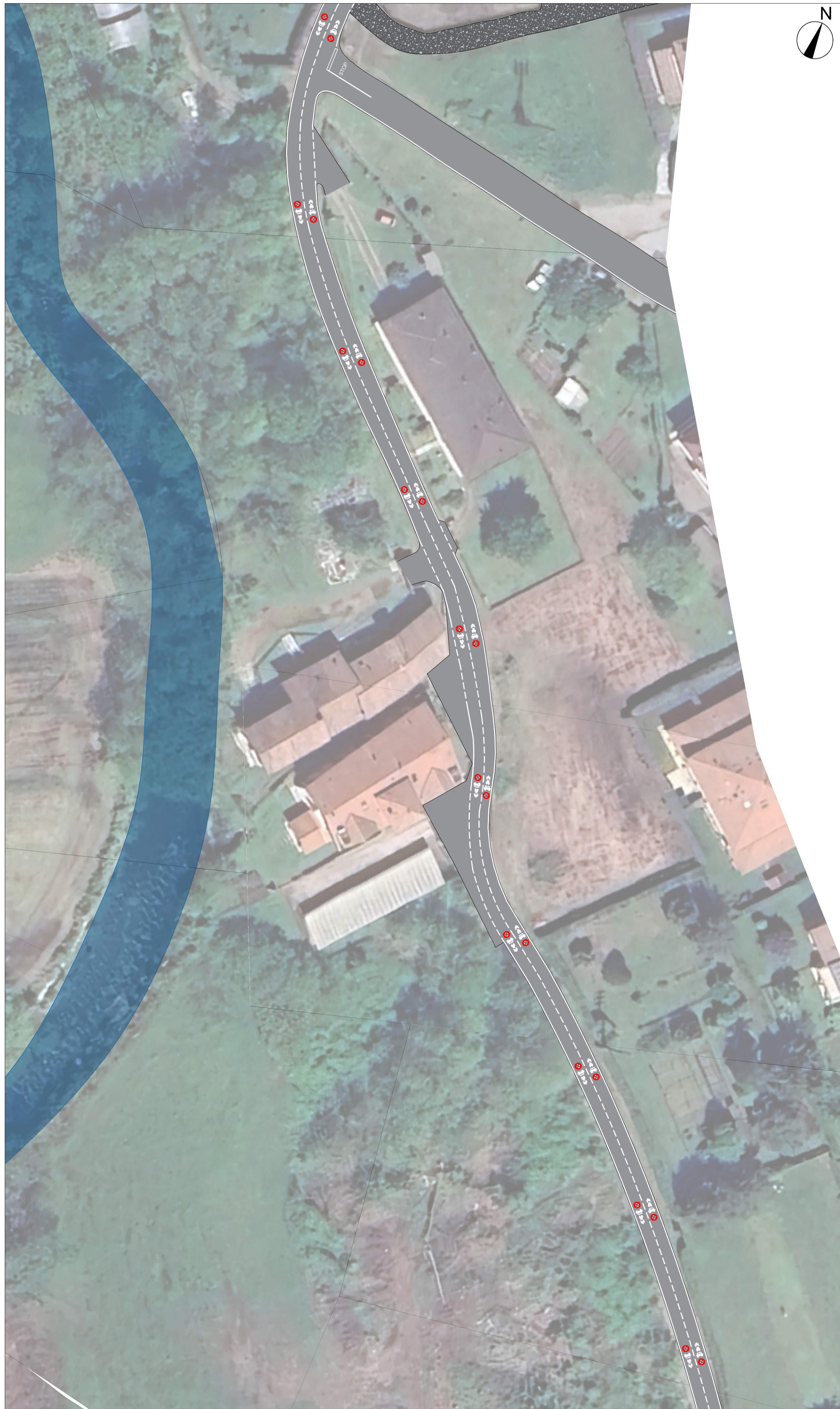
STATO DI PROGETTO Scala 1:500