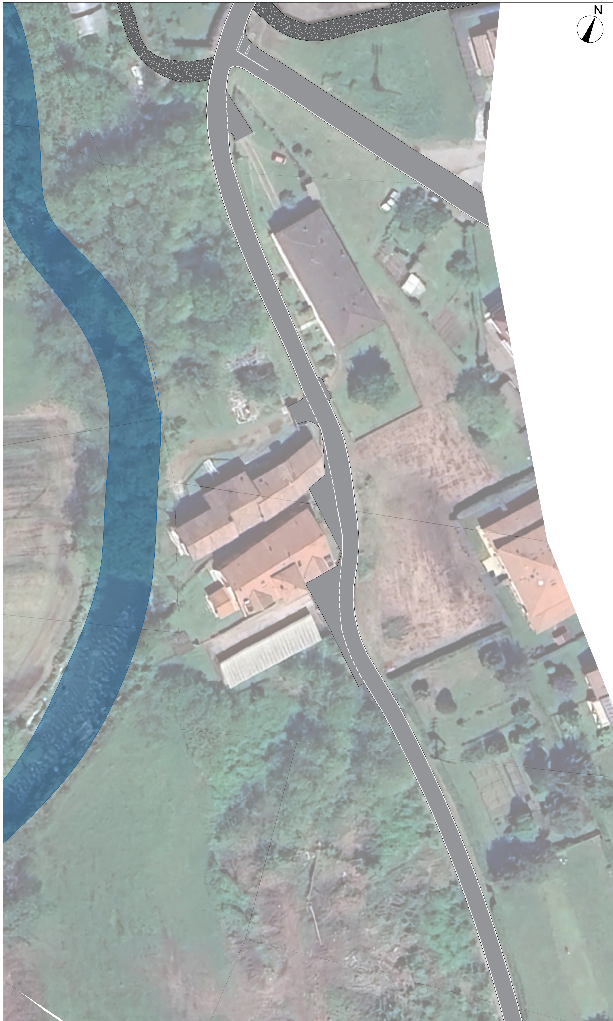
STATO DI FATTO Scala 1:500