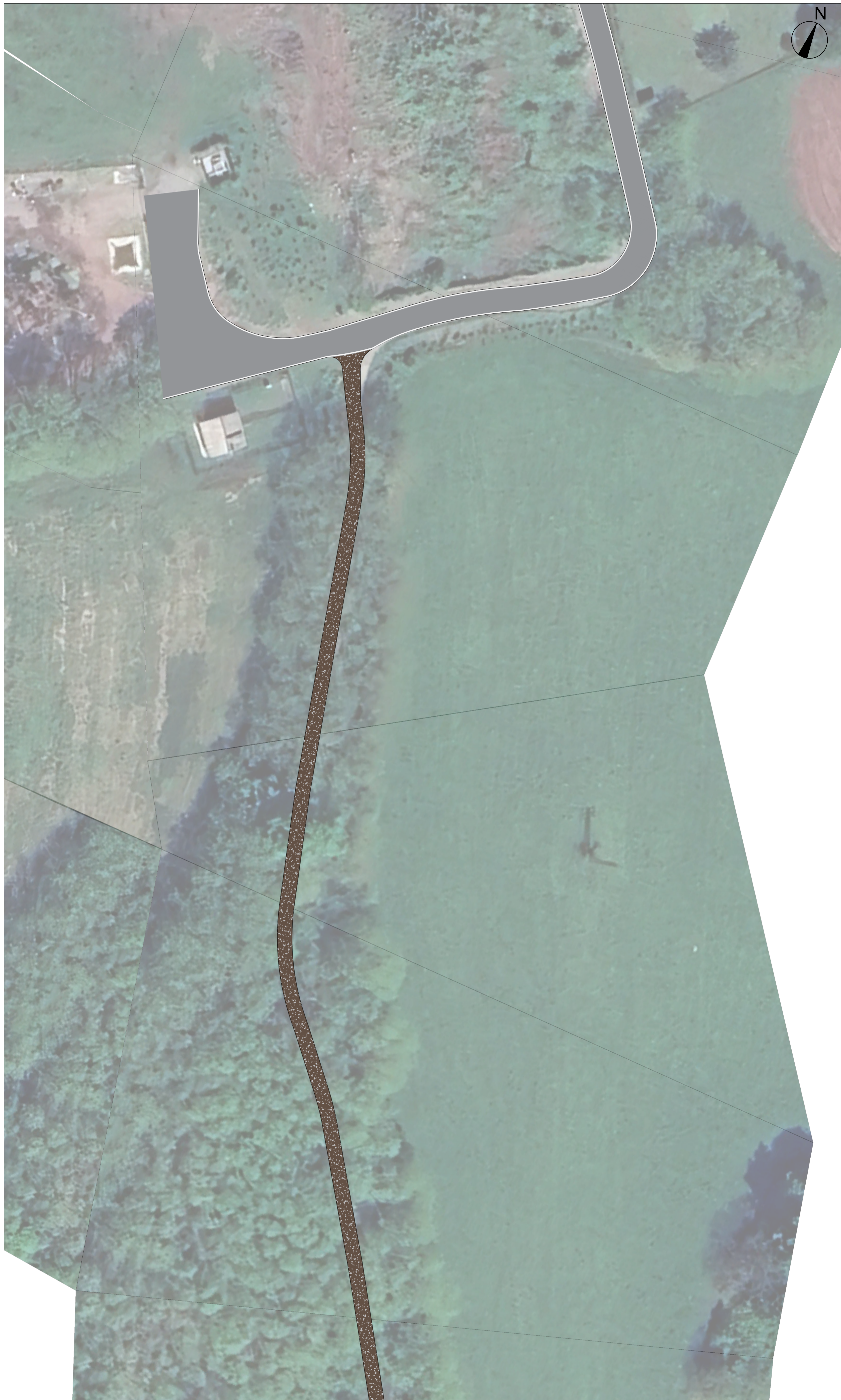
STATO DI FATTO Scala 1:500