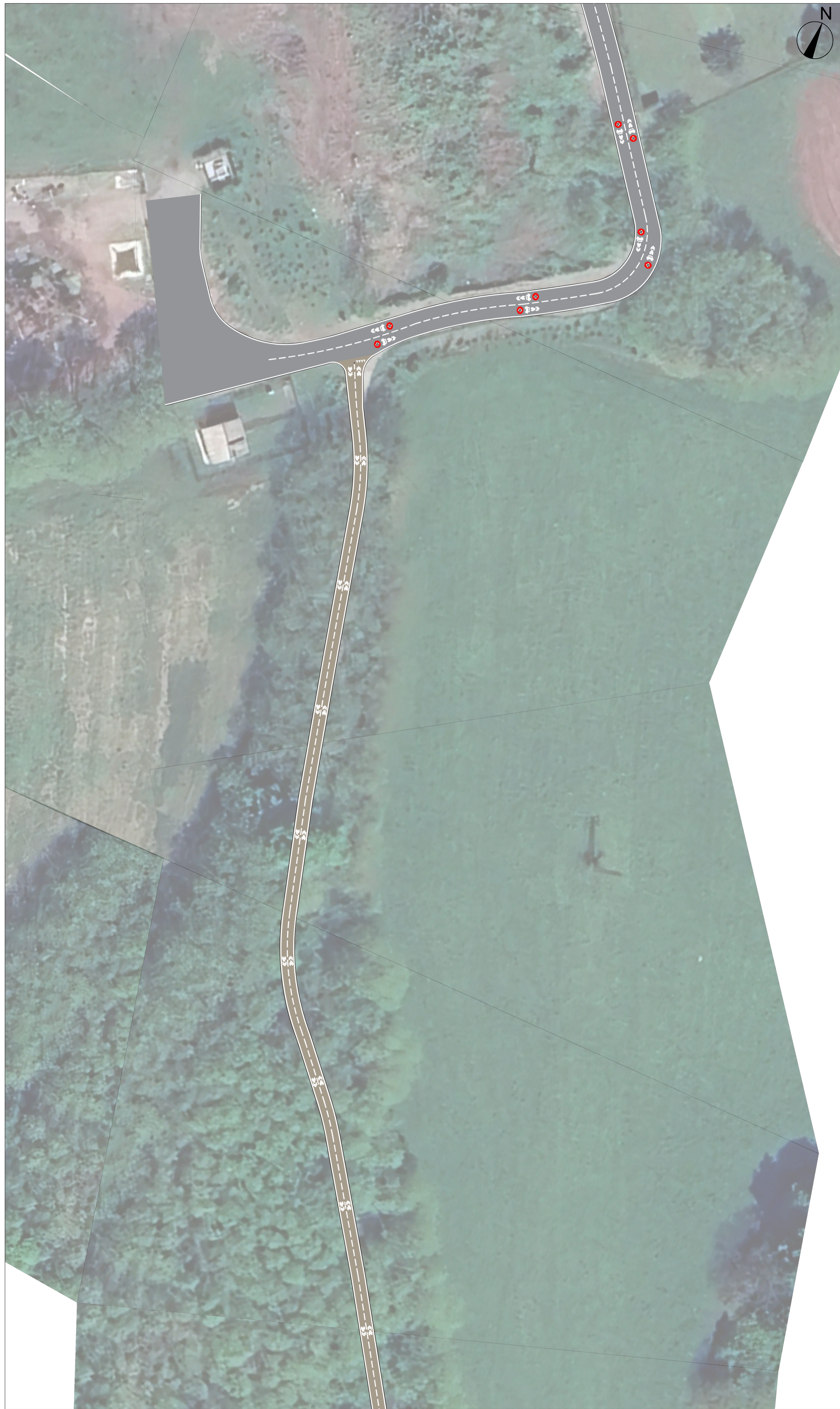
STATO DI PROGETTO Scala 1:500