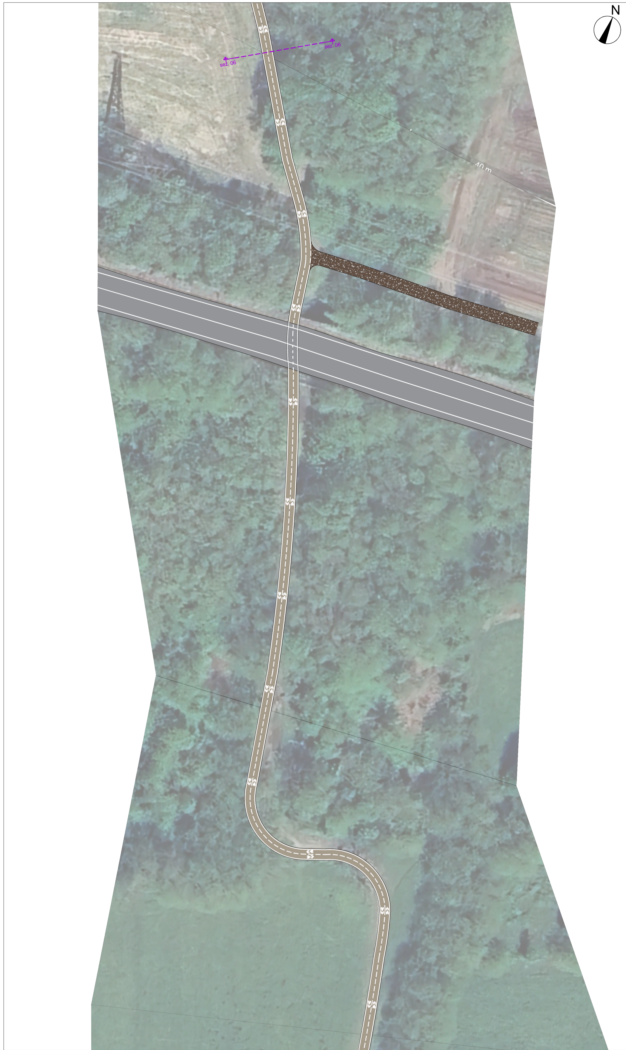
STATO DI PROGETTO Scala 1:500