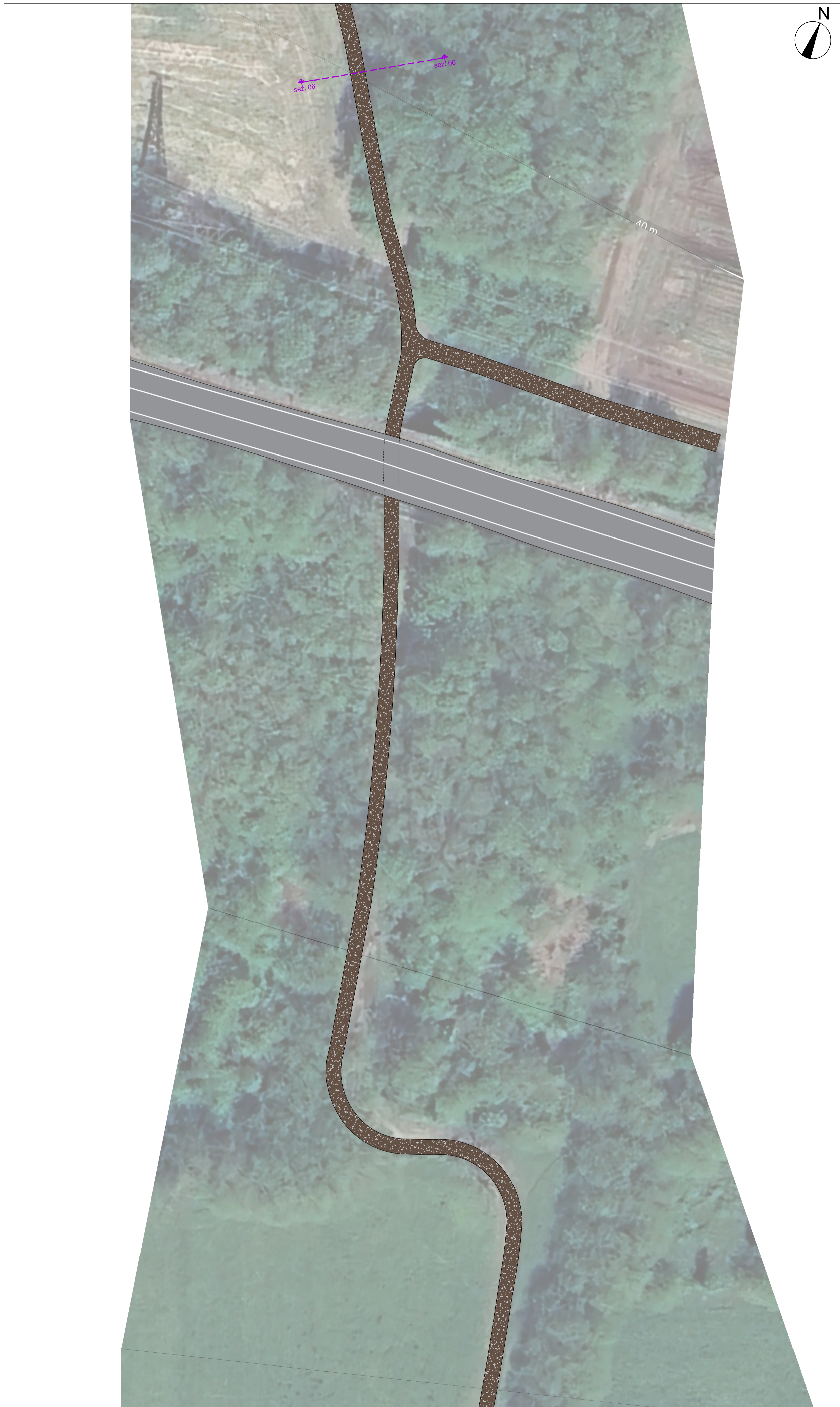
STATO DI FATTO Scala 1:500