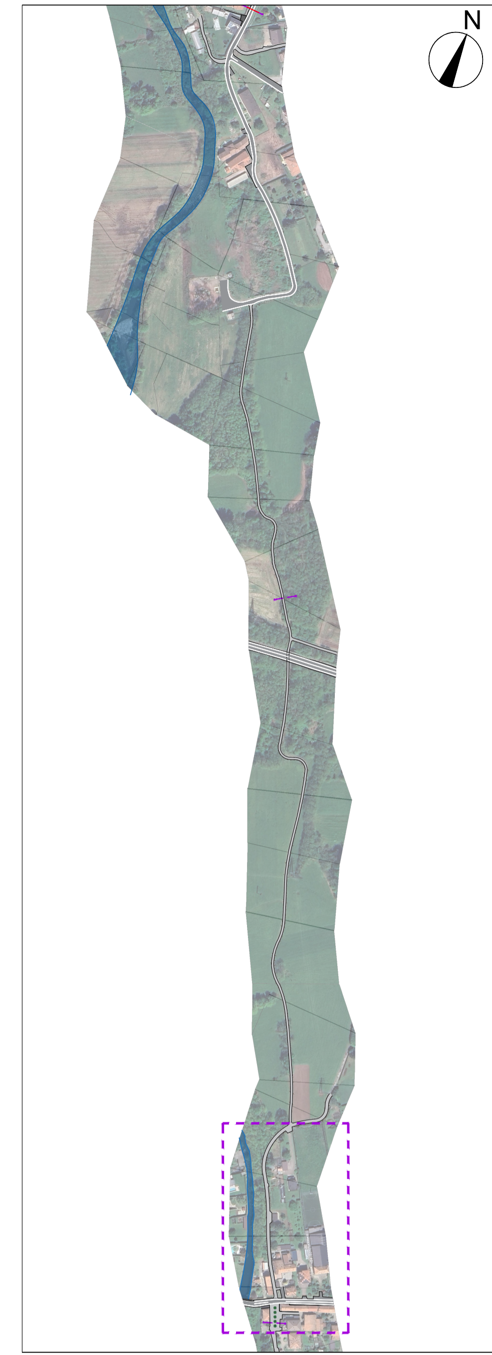
Inquadramento - 1:5000