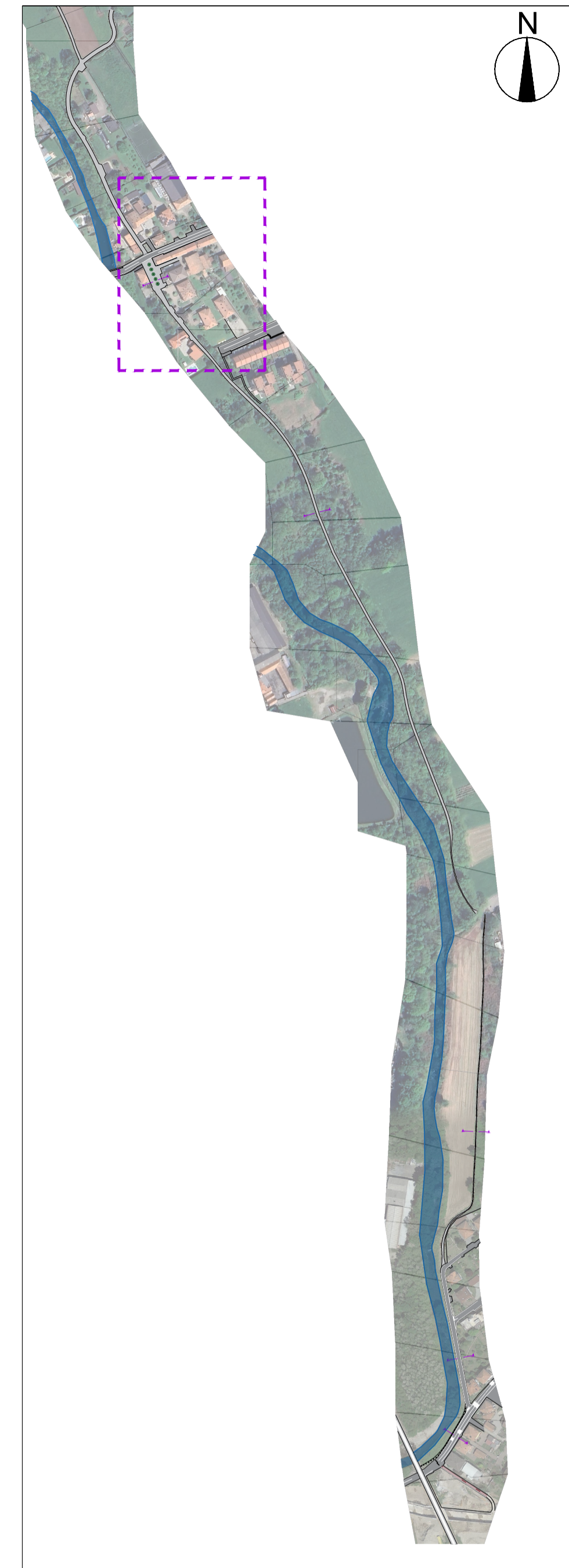
Inquadramento - 1:5000