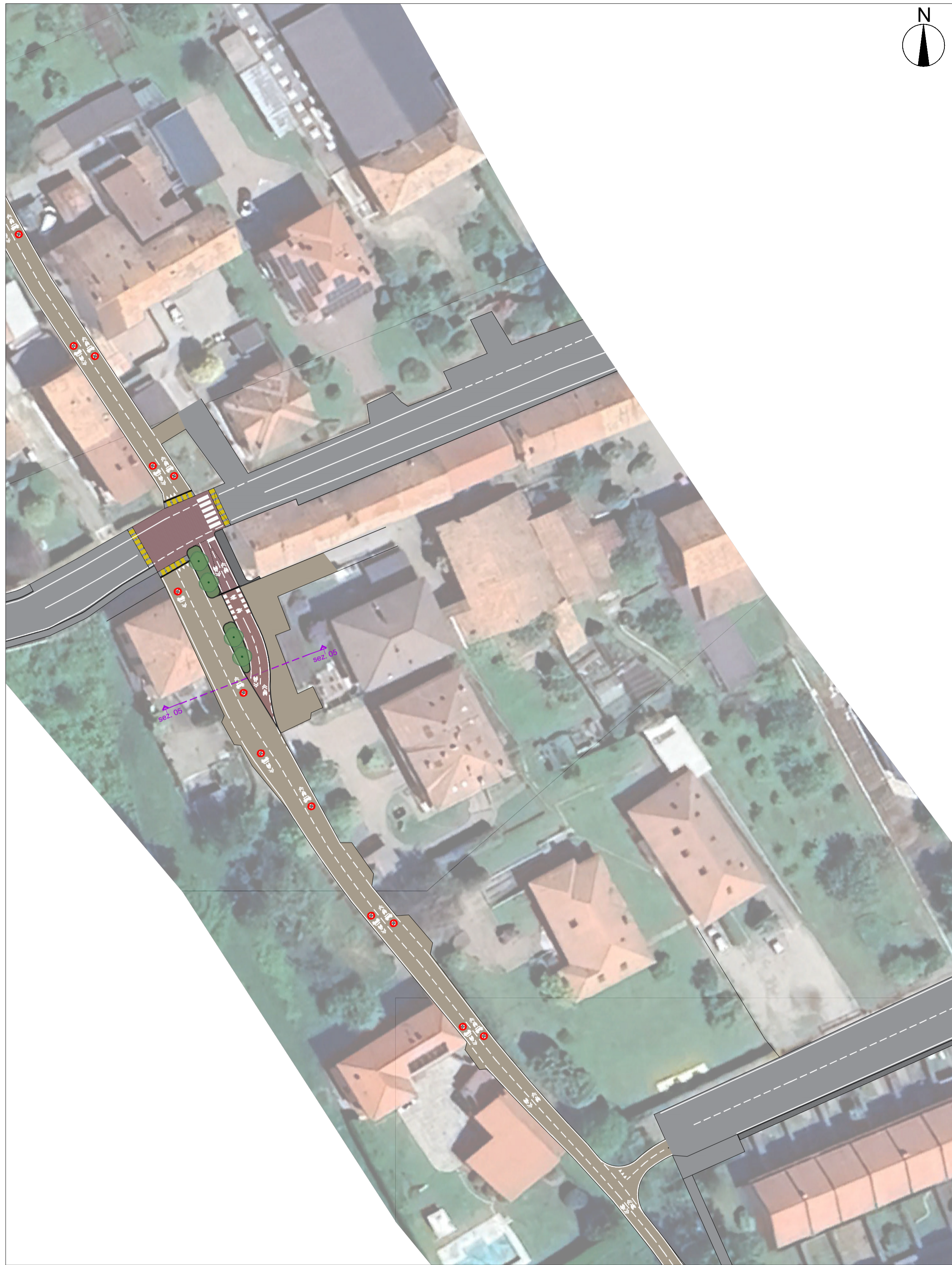
STATO DI PROGETTO Scala 1:500