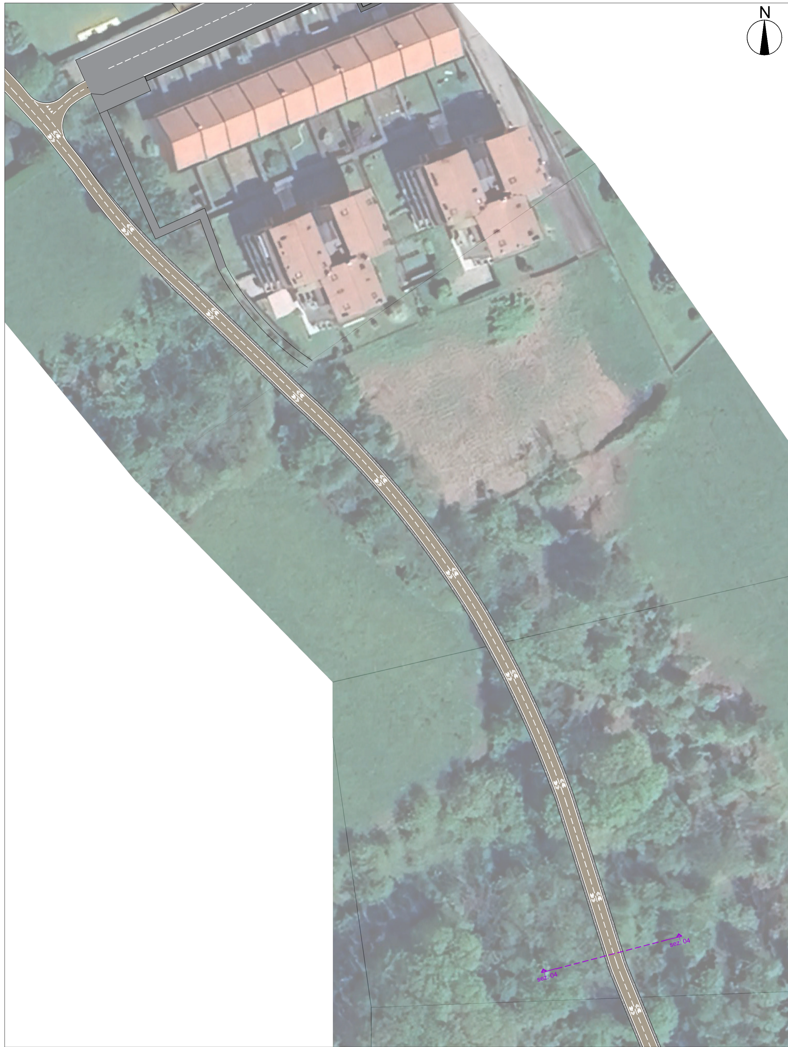
STATO DI PROGETTO Scala 1:500