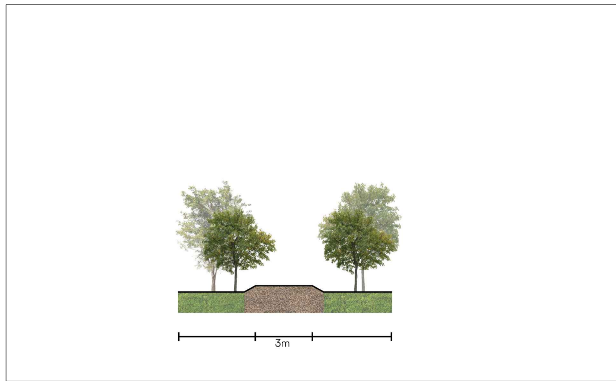
STATO DI FATTO Sez.04 - 1:200