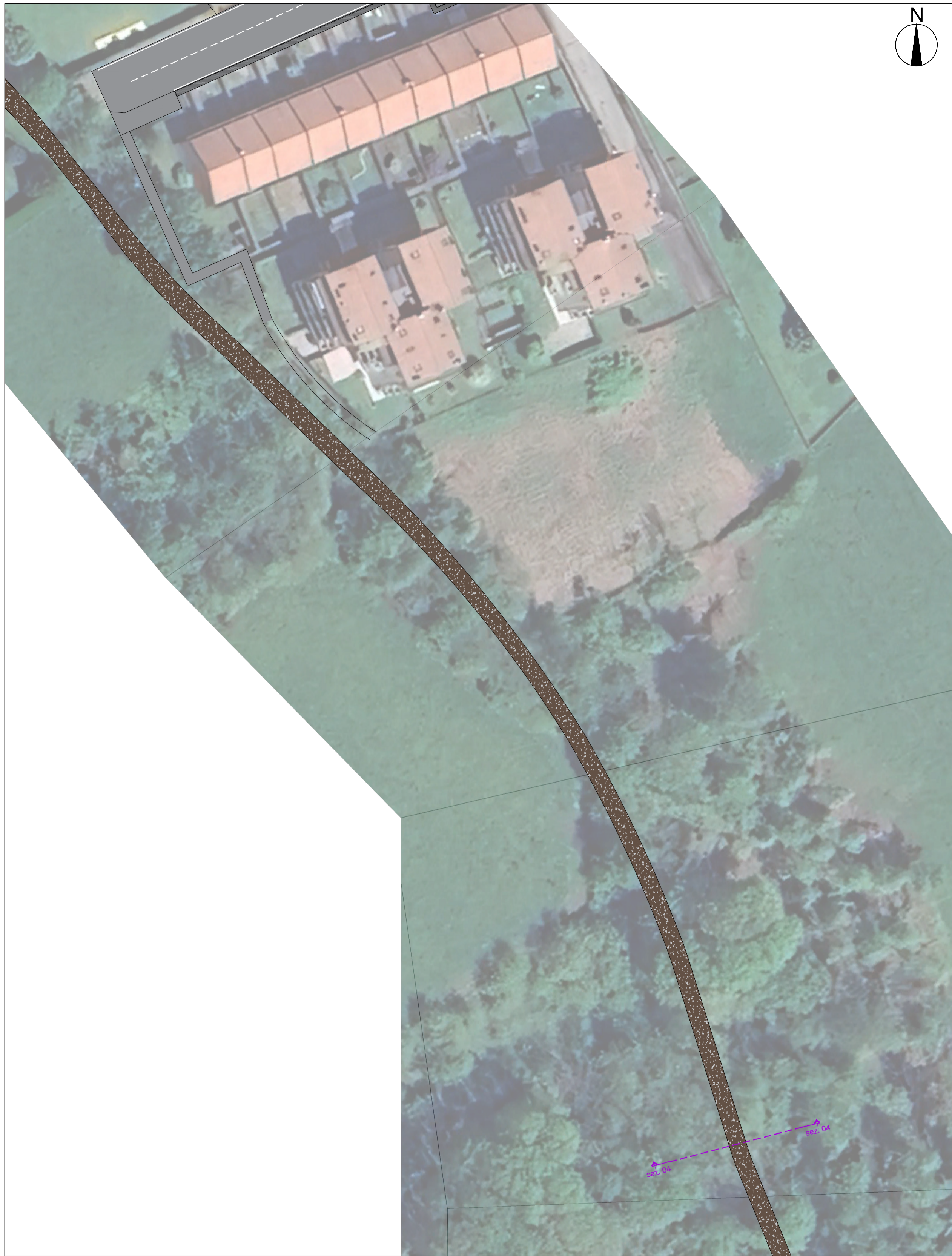
STATO DI FATTO Scala 1:500