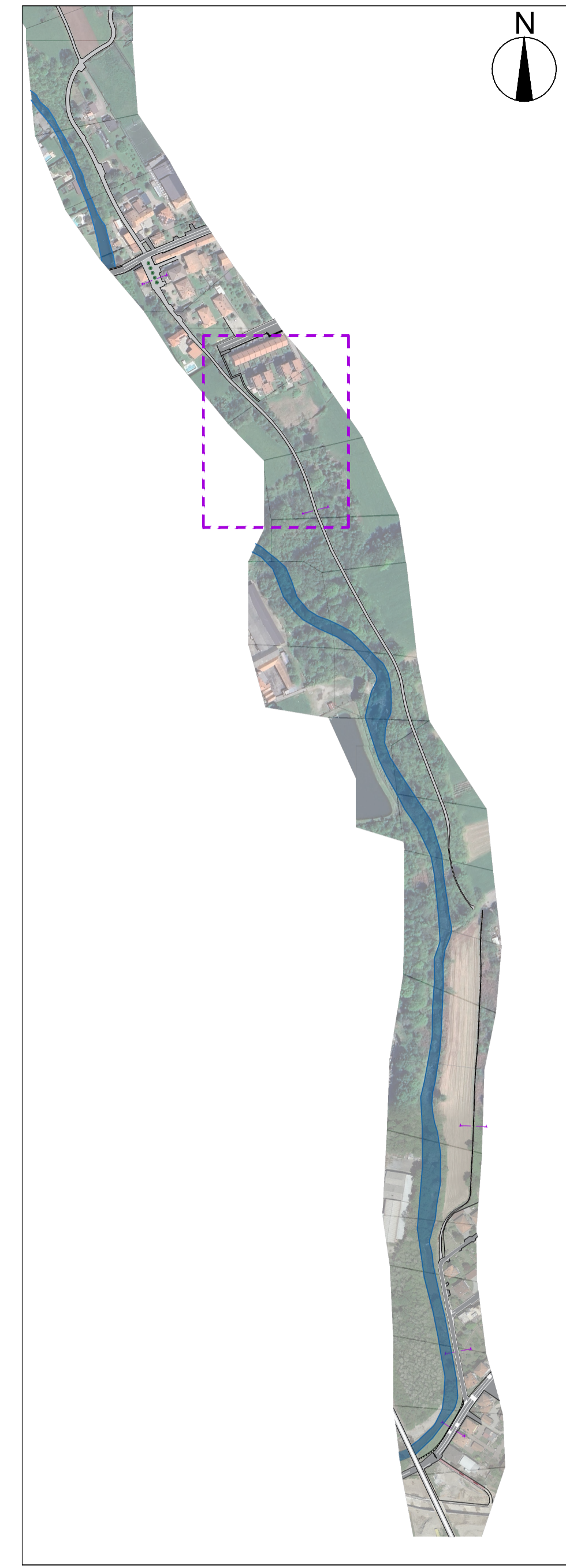
Inquadramento - 1:5000