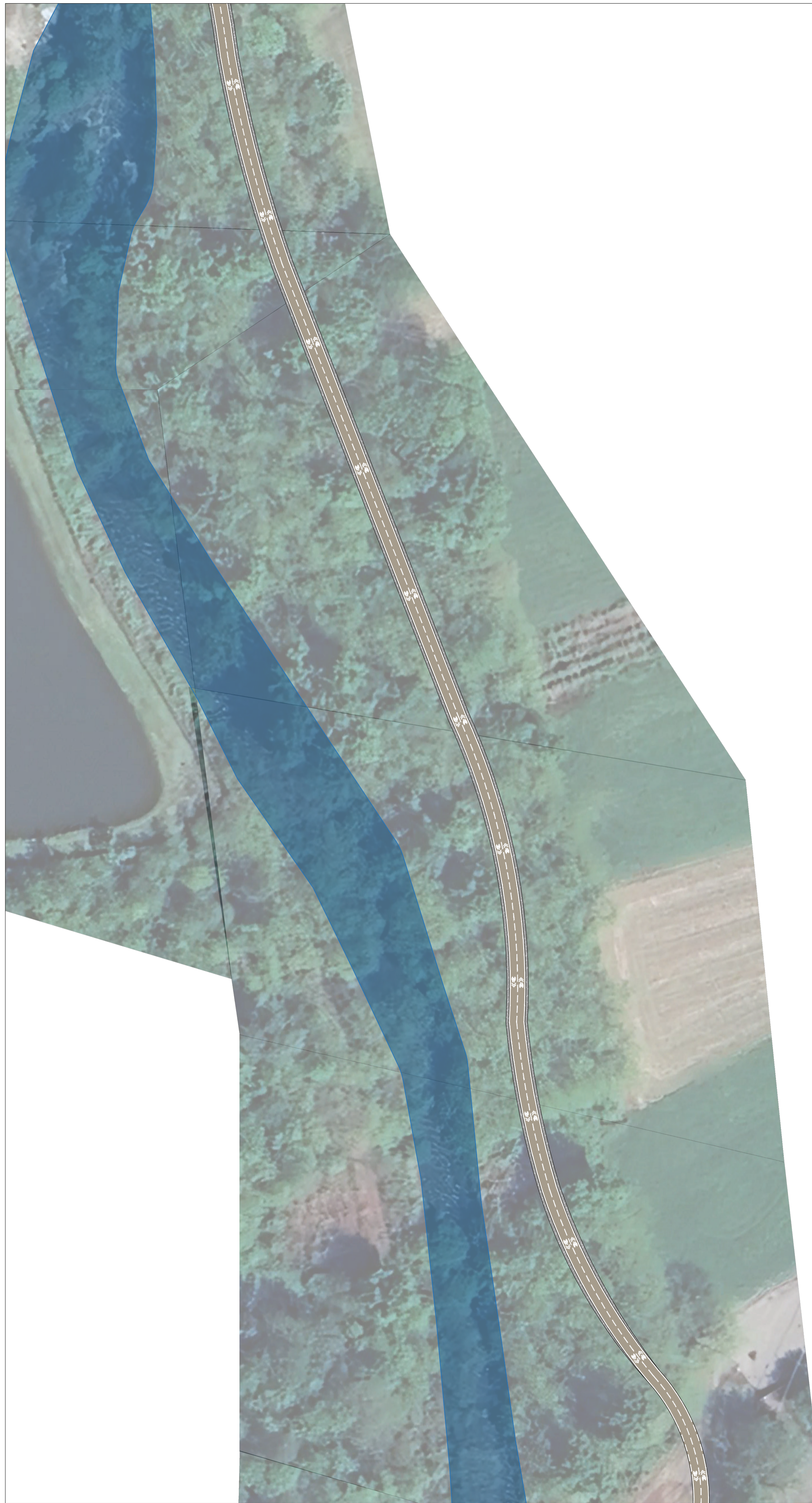
STATO DI PROGETTO Scala 1:500