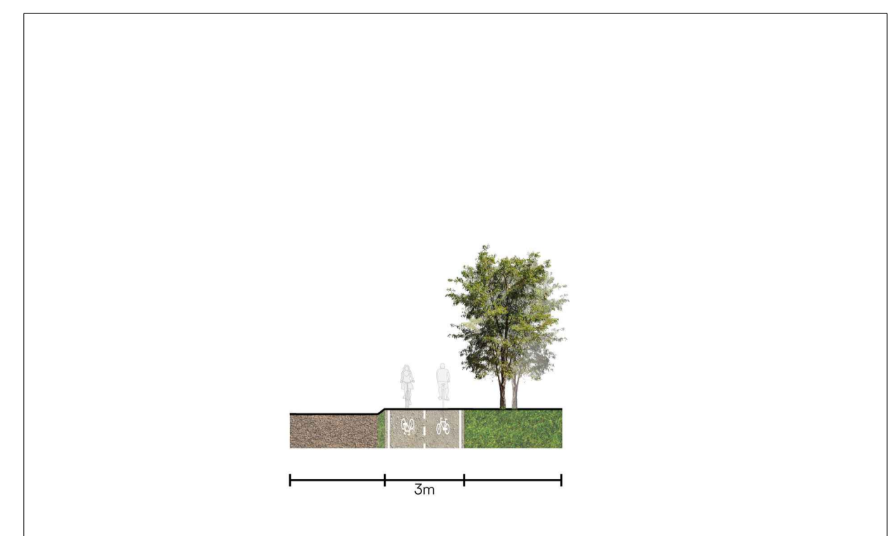
STATO DI PROGETTO Sez.03 - 1:200