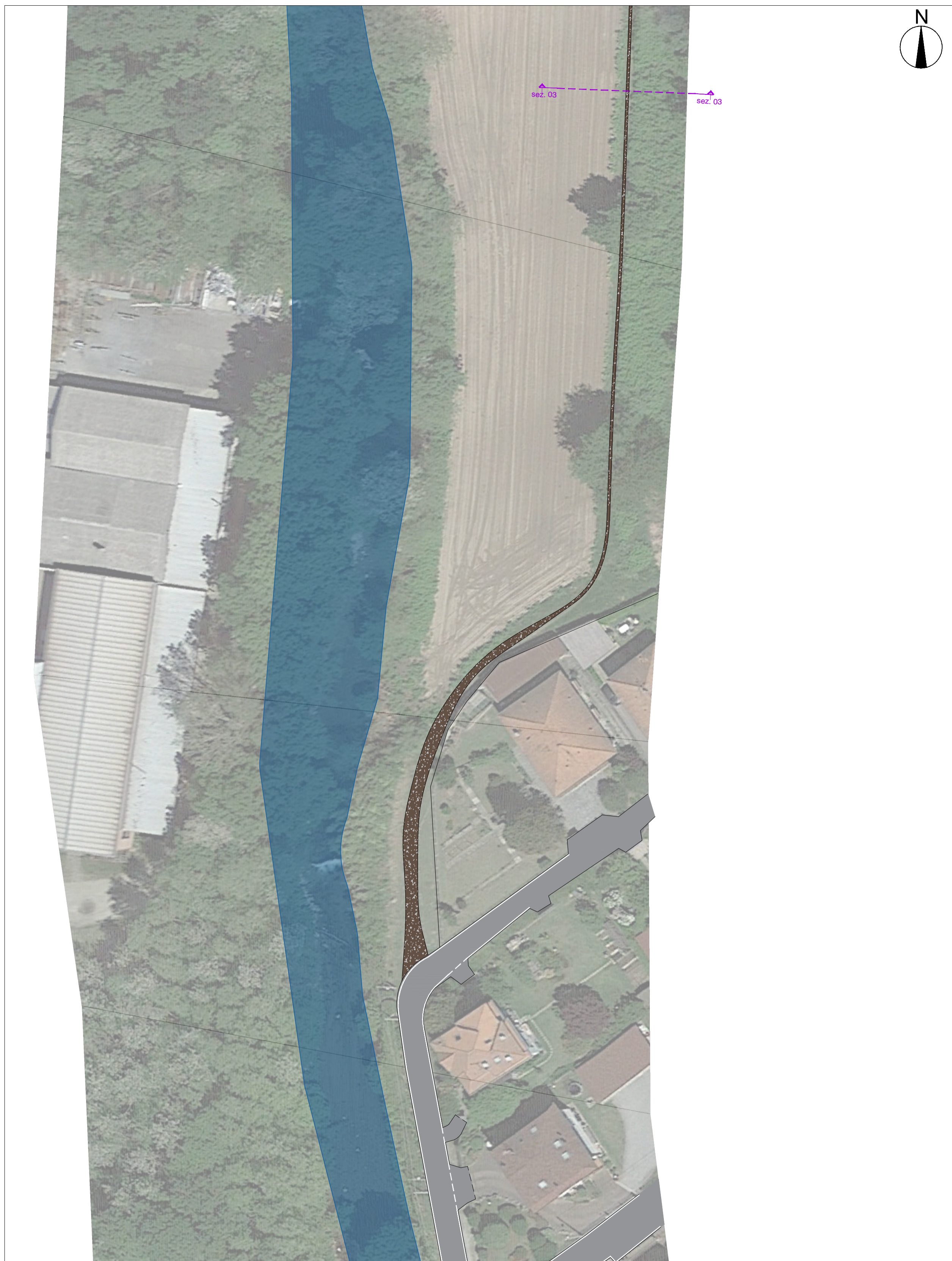
STATO DI FATTO Scala 1:500