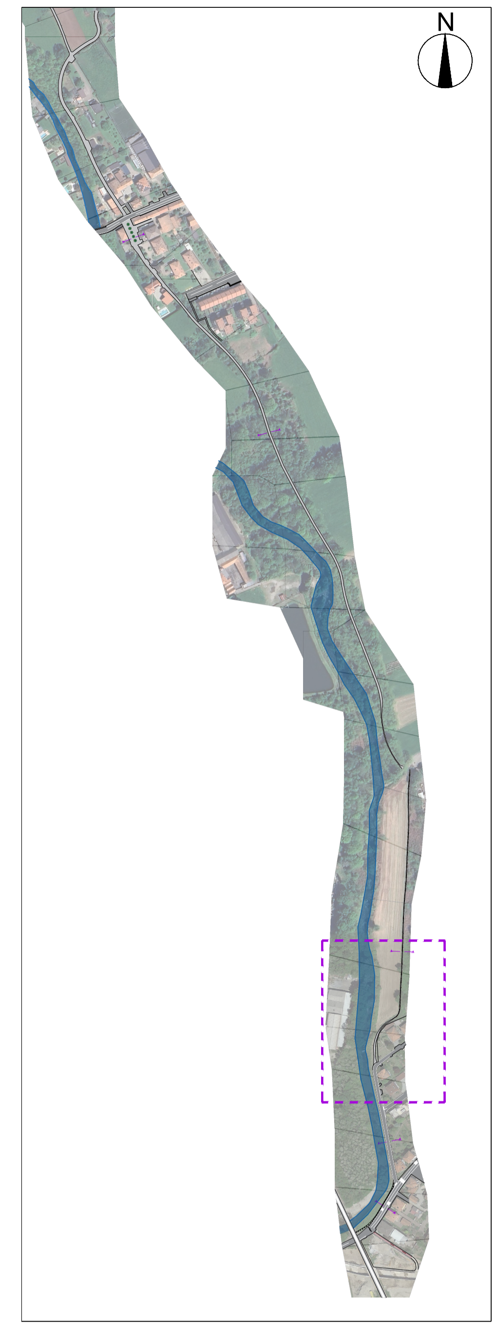
Inquadramento - 1:5000