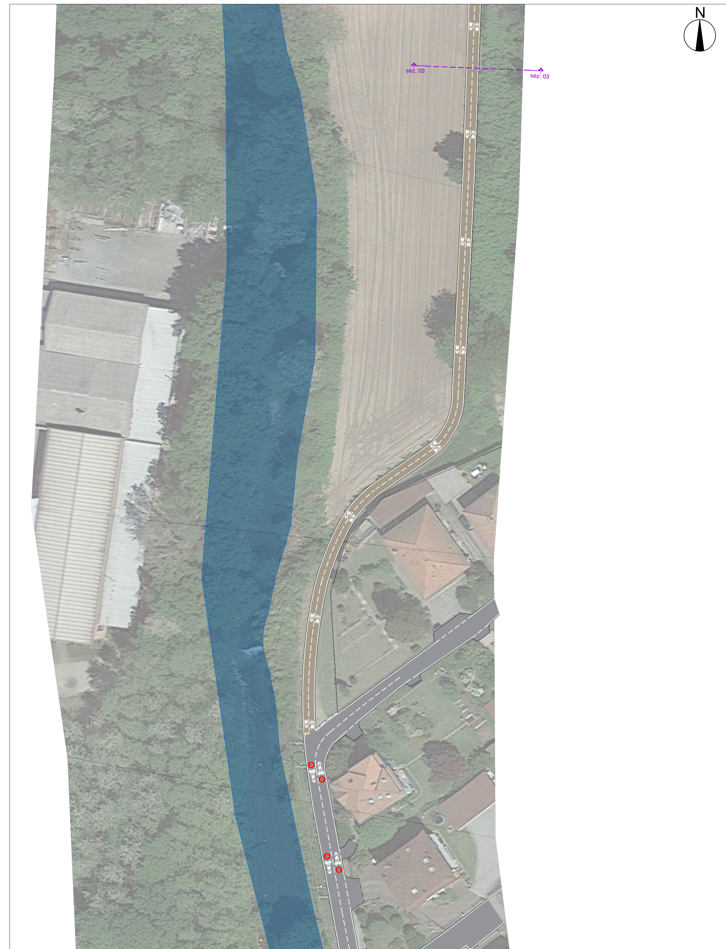
STATO DI PROGETTO Scala 1:500